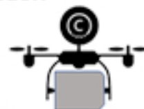
Abb.: Drohne mit DRYcloud UAV – schematisch Tim Schäfer

DRYcloud ist eine Marke und ein Schutzrecht!